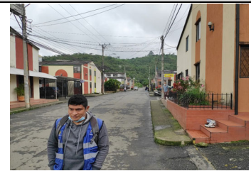
Recorrido de control