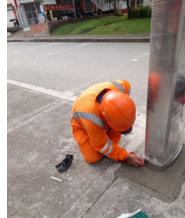
Verificación de las actividades de BOAL