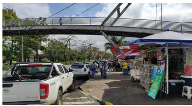
Verificación de paisajística para la implementación de señalética