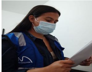
Revisión y aprobación de actas de entorno de cierre