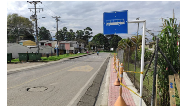
Verificación de la señalización implementada en obra