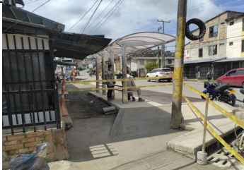
Verificación de actividades