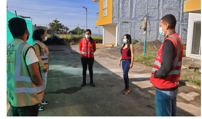
Seguimiento al proceso de capacitación mensual a la mano de obra