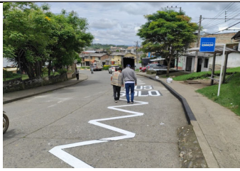
Chequeo de señalización